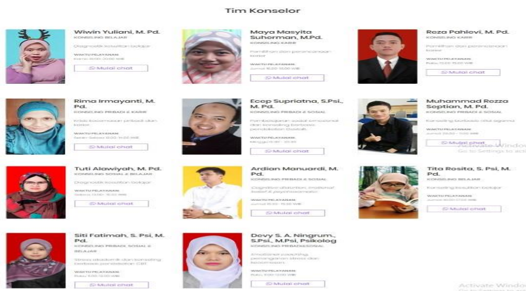
Gambar5.2 Konselor Pada Aplikasi E-Counseling IKIP Siliwangi

Aplikasi berbasis web-counseling tersebut akan terus dikembangkan berdasarkan saran dan perubahan zaman untuk menjawab berbagai pertanyaan sebagai salah satu produk pelayanan konseling di era post-modern .