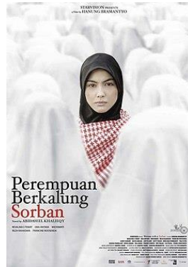
Gambar 2. Poster Film Perempuan Berkalung Sorban

pesantren. Pesantren melarang santri membawa peralatan elektronik. Namun adegan santri menyembunyikan radio, saat seorang ustaz memeriksa kamar. Begitu juga saat pengurus membangunkan salat subuh menemukan handycam lalu menyerahkannya kepada kiai. Merokok dan mengintip perempuan, keluar ke pasar malam dan menonton acara dangdut yang dinyanyikan biduan perempuan ditampilkan berulang dalam film ini.