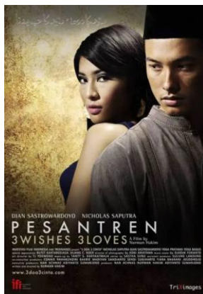
Gambar 1. Poster Film 3 doa 3 Cinta

Setelah lulus Huda memiliki rencana untuk mencari keberadaan ibunya yang sudah lama tidak dijumpainya dengan bantuan Dona -seorang penyanyi dangdut- yang dikenalkannya. Mendapatkan hadiah perekam video, Rian mempunyai rencana pulang ke Surabaya melanjutkan usaha video milik ayahnya. Sedangkan Syahid yang berasal dari keluarga miskin sempat bergabung dengan kelompok radikal di luar pesantren yang memiliki jaringan dengan teroris.