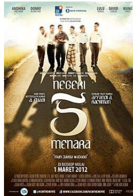
Gambar 3. Poster Film Negeri 5 Menara