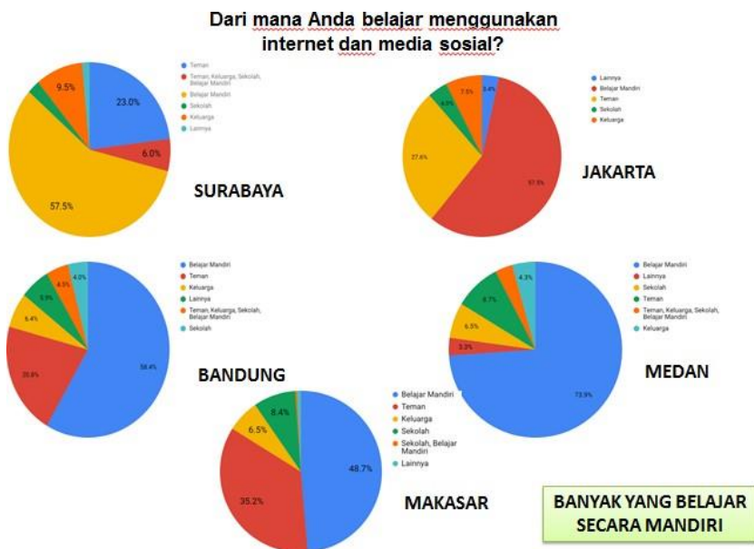
Gambar 2 ‘Sumber Belajar Internet para Santri’

Dapat dibayangkan bagaimana seseorang yang belajar tanpa guru yang benar, maka gurunya adalah setan, sehingga akan mengarahkan pada hal yang sesat. Hal sesat dapat mempermudah cepatnya penyebaran konten negatif, paham radikal yang merebak di masyarakat dengan sarana media internet. Sering dijumpai seorang generasi milenial yang terpapar hal radikal kemudian dalam kehidupannya juga akan menjalani aktivitas radikal tersebut. Apabila hal itu dibiarkan akan menyebabkan banyak aktivitasnya merugikan dirinya dan masyarakat secara umum.