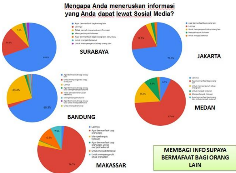
Gambar 2 'Alasan Membagi Informasi di Media Sosial'

Hal menarik yang ditemukan dalam riset ini adalah, bagaimana niat berbagi kalangan santri sebagai hasil didikan dunia pesantren ternyata juga menjiwai santri tersebut saat beraktivitas di internet. Banyak informasi yang mereka dapatkan tersebut, dan menurut mereka hal bermanfaat, dengan mudahnya terlihat di semua kota cenderung meneruskan informasi tersebut kepada orang lain. Hal ini dilakukan supaya orang tersebut juga dapat mendapatkan manfaat dari informasi itu. Fenomena ini adalah hal yang sangat baik bagi kebutuhan untuk percepatan penyebaran informasi yang bermanfaat bagi orang lain, tetapi juga dipahami bahwa hal ini merupakan sesuatu yang perlu diwaspadai, jika karena kurang pemahannya mereka tentang informasi tersebut membawa manfaat atau tidak, dan menurut mereka info itu bermanfaat sehingga dengan mudahnya disebarakan begitu saja, apa yang terjadi pasti dapat kita prediksi bagaimananya.